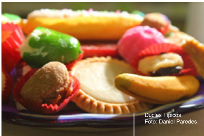
Dulces Típicos